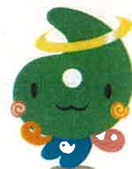
埼玉県社協マスコット 「シャキたまくん」

https://jinzai.fukushi-saitama.or.jp/kaigoloan_2.html